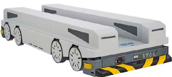
Smartlog ha coinvolto SIBA per la parte trasloelevatori, miniload e navette automotori per la movimentazione pallet del committente Innocenti Depositi

SIBA, invece, da più di vent'anni progetta, costruisce e installa trasloelevatori, satelliti automatici, miniload e shuttle. X